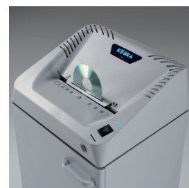
AUTO START & DISTRUZIONE CD Avviamento e spegnimento automatico a fotocellule. Flap integrato per la distruzione di CD, DVD, Floppy-Disk e carte di credito